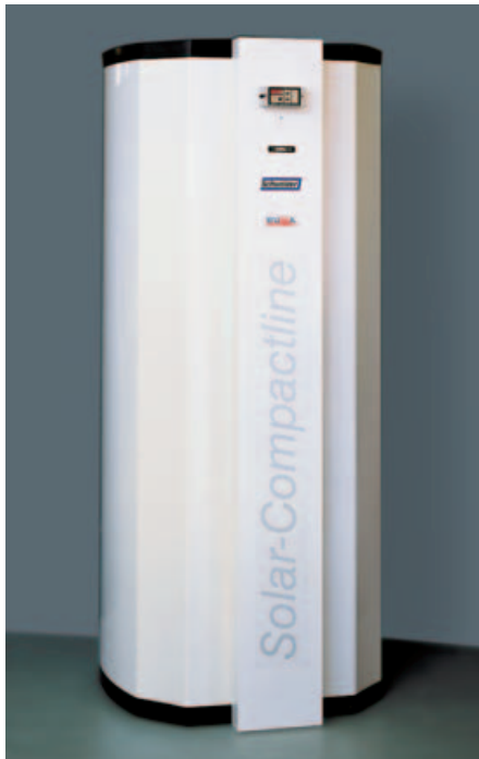
Frontseitige Ansicht Wassererwärmer mit Solarsteuerung