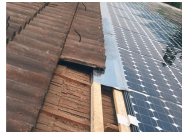
Schritt 12: Firstbleche setzen und Dach fertig eindecken.