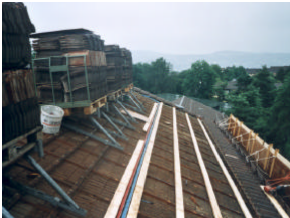
Schritt 3: Lattung gemäss Rasterplan setzen, Kabelkanäle montieren und Stringkabel verlegen.