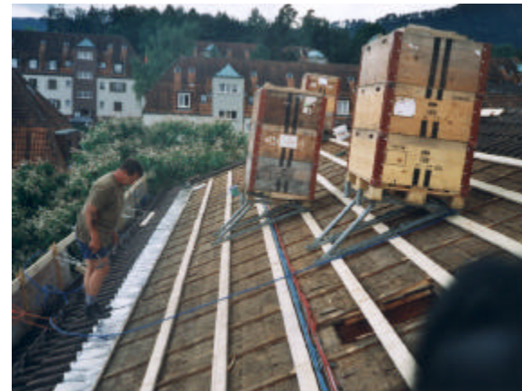
Schritt 4: Bleilappen oder untere Abschlussbleche montieren.