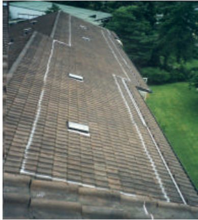
Schritt 1: Markieren der Anlageplatzierung auf dem Dach.