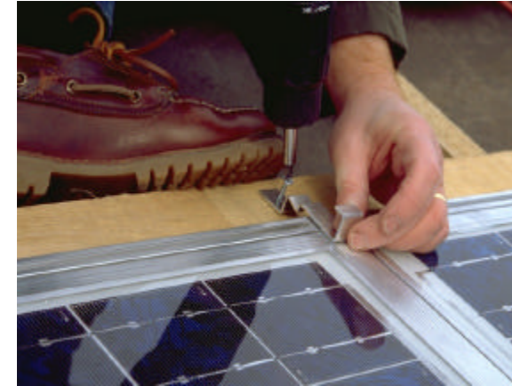
Schritt 7: Klammer setzen über Modul, mit oder ohne Anschlagholz