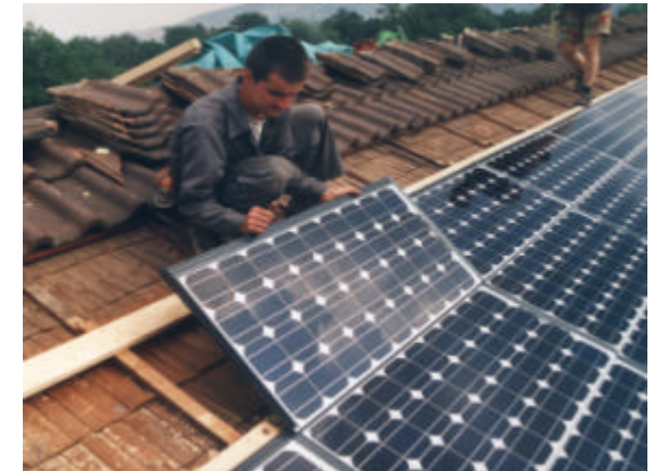
Schritt 10: Modul ablegen. Schritte 7 bis 10 wiederholen, bis alle Module verlegt sind.