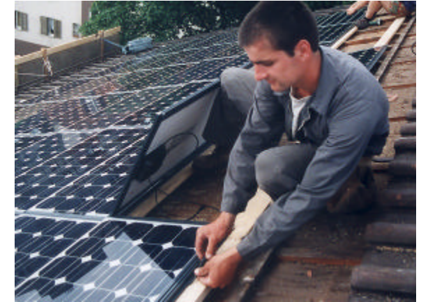
Schritt 8: Modul gemäss Verkabelungsplan verdrahten