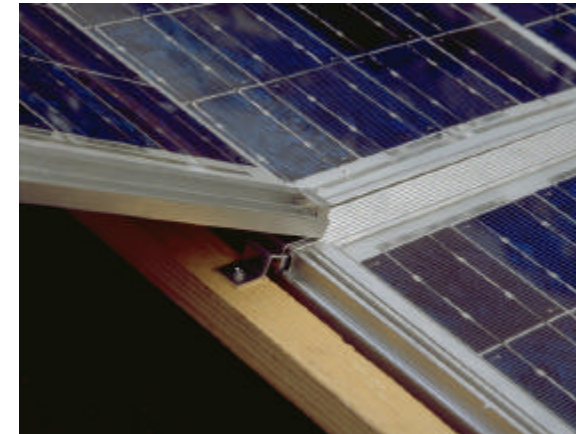
Schritt 9: Modul einklinken