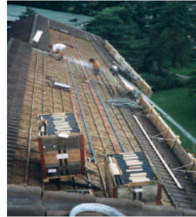
Schritt 2: Abdecken der Ziegelei, entfernen der Ziegellattung, bei Bedarf Konterlattung aufdoppeln. (entfällt bei Neubau.)