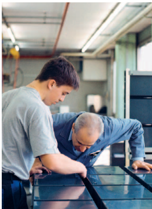
Wissensvermittlung in der Briefkasten-Produktion